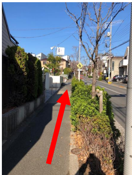
⑥道なりに坂道を上ります。