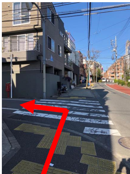
⑦信号のない横断歩道が見えたら角を左折します。