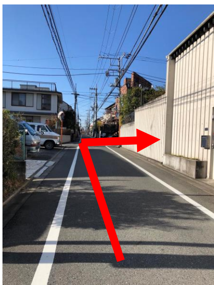
⑨道なりに歩きます 一つ目の角を右折します。