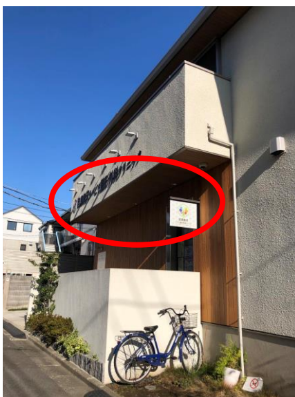
⑩向かって右側に クリニックが見えます。