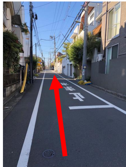
⑧世田住宅街の中を歩きます。